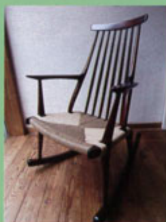
ロッキングチェア ナラ・漆 林靖介 工房H