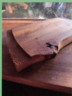
花台 栗 小山亨 k. factory

館内に足を踏み入れると木の香りに つまれます。広い窓辺を持つ空間 には工房作家の木工家具が並びます。 河内材を使った家づくりのご提案もあります。 木のある暮らしを選んで気づくさまざまなこと。 あなたのお立ち寄りをお待ちしています。